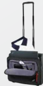
ThinkPad Radiant Roller – Best.-Nr.: 78Y2375