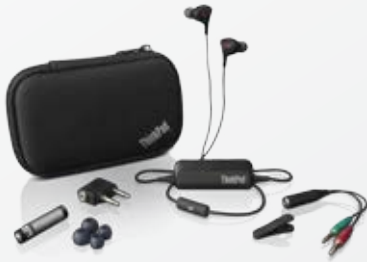
ThinkPad® Ohrhörer mit Geräuschunterdrückung (0B47313)