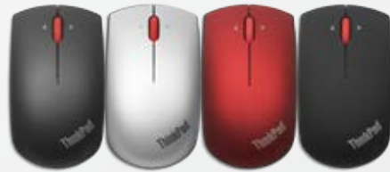
ThinkPad Precision Wireless-Maus – Midnight Black 0B47163; Heatwave Red 0B47165; Frost Silver 0B47167; Graphite Black 0B47168; Midnight Black 0B47153