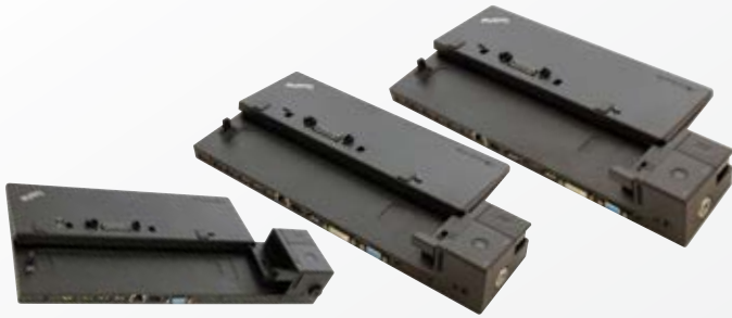
ThinkPad® Ultra Dock (40A20090XX), ThinkPad® Pro Dock (40A10065XX), ThinkPad® Dock (40A00065xx)