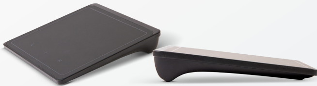
Lenovo® Wireless Touchpad (für T440s Modelle ohne Touch-Funktionalität) (0A33909)