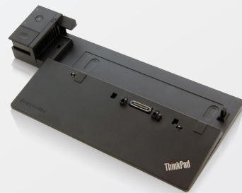
ThinkPad Pro Dock – 90 W (40A10090xx)