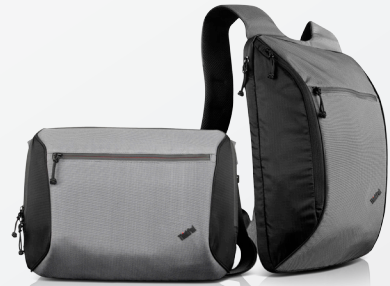
ThinkPad® Ultralight Topload (0B47307) und Rucksack (0B47306)