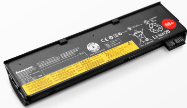
ThinkPad Akku 68+ (6 Zellen) (0C52862)